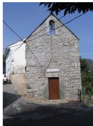
Iglesia de El Rebollar