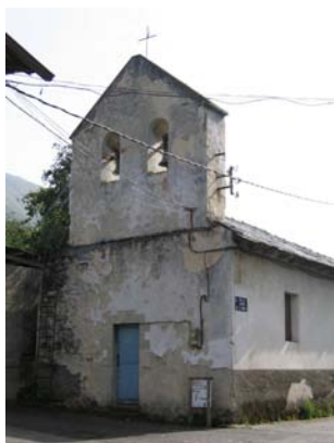
Iglesia de Degaña